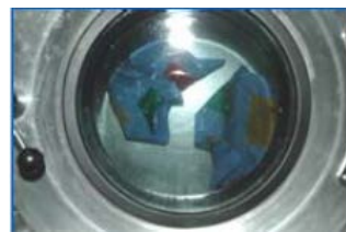
型崩れを起こさない 新たな洗浄方法

顧客情報を電子カルテ化し、顧客の生活環境に合った衣料品のメンテナンスサービスを提供するとともに、水洗いとドライの長所を併せ持つ洗浄方法の開発により、新規需要を開拓します。