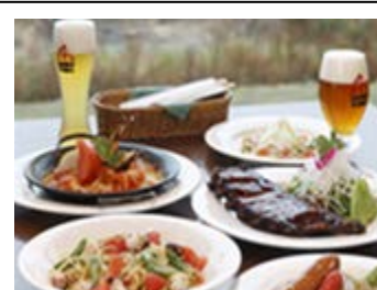
地ビールレストラン