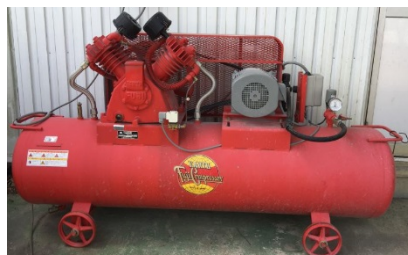
エアーコンプレッサー