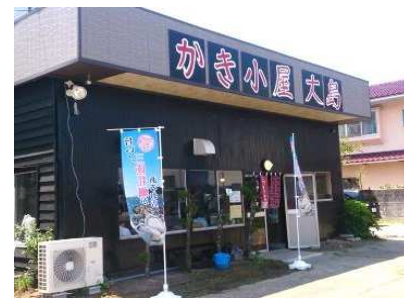
店舗風景(上) 商品写真(下)

飲食店の新規開店に向けて、まず必要となる器具や備品についてアドバイスした。特に、海鮮関係で生ものを扱うことで、必要となる備品について情報提供を行い、併せて近隣住民へ配慮する観点から、網焼きの煙の排出を抑制するため、炭火でなくガス燃料の使用をアドバイスした。次に器具や備品について、仕入先や購入先を紹介するとともに、開店にかかる許可手続きの進め方をアドバイスした。加えて、開店後の集客にあたり、宣伝経費をかけず、顧客の口コミにて店舗のPRを行う手段として、インターネットやSNSを活用するよう情報提供した。