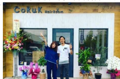
店舗風景(上) チラシ(下)

まずは、開店告知用チラシを作成にあたり、使用するソフトウェアの使用方法及び表現方法等について指導した。次に宣伝効果のあるチラシ作成のポイントを指導し、ラフデザインを少しずつ修正し、完成度を高めてもらった。幾度かの修正を重ねていくうちに本企業事業者のイメージしていた希望のデザインで完成することができた。さらに、今後、新たなデザインを作成するのためにデザインの編集方法等ソフトウェアの高度な使用方法についてもアドバイスした。