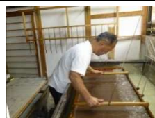
楮(こうぞ)栽培からの和紙づくり

支援を通じて自社の強みを再確認することができるとともに、強みを生かした価格の再設定を行うなど、今後の経営方針を明確にすることができた。また、専門家からシックハウス症候群がでない家造りへの和紙の活用を提案され、塗壁材を開発している工務店を紹介されたことで、建築分野に販路を広げることができ、和紙の新たな価値が創造された。さらに、本企業の強みである、様々な用途に応じた紙漉きの高い技術により紙として和紙を使用するだけでなく、修復分野や、高級洋菓子店の包装紙など和紙が活用される分野が拡大しており、京都の伝統産業としての認知が高まってきている。