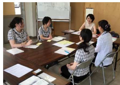
・ マナー研修風景(上) マニュアル(下)

まず、事業主と従業員から電話対応と接客対応の問題点についてヒアリングしたうえで、女性従業員を集め、当該問題点の現状とその課題解決策について、ディスカッションした。さらに、女性従業員全員の自発的な行動に繋げるため、その内容を電話対応、接客対応マニュアルとして作成することを提案し、作成手順を説明した。複数回のメールのやり取りを経て完成に至ったマニュアルを基に、マナー研修とロールプレイングを実施し、丁寧な電話対応、接客対応の定着を図った。