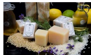
本企業主力商品 洗顔化粧石鹸(優美)

催事における出展ブースのディスプレイ・デザインの提案(商品の配置やライティング等)を行うとともに、今後は自社単独で効果的なディスプレイが再現できるように指導を行った。また、現地で、HPなどで使用できる商品写真の撮影指導も行った。