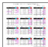
年間休日カレンダーを作成

現在、ハローワークを通じて新卒社員の求人募集を行っているが、社内の労働条件を整備することは、本企業の強みとなり、学校の就職担当者にも十分アピールできると考えられる。