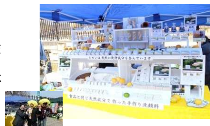
第1回せとだレモン祭への出展ブース

「せとだレモン祭」のイベント会場に来られたお客様だけでなく、近隣の商社の方にも興味を持っていただき、今後の人脈作りにつながった。初対面の方ばかりだったが、購入だけでなくギフト依頼も承ることができた。今回撮影した商品写真は、既に本企業HPの商品紹介でも使用しており、商品のイメージアップにも繋がっている。また、今回の支援により得た最も大きな成果は、本企業が単独で効果的なディスプレイを再現できるようになったことである。今後、さまざまなイベントを通じて、効果的に自社商品をPRできるノウハウを習得できた。早速、次回参加のイベントで実践予定である。