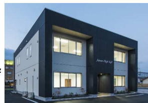
出雲市西新町の本社

まず、現在の工事管理システムの運用方法について詳細にヒアリングを実施した。従来のパッケージソフトにクラウド方式を導入するにあたり、プログラムの調整及びシステム修正についてアドバイスし、工事管理システムの課題を明確にし、改善目標を設定した。また、土木・建築の見積作成システムをExcel等出力により標準化するとともに、工種別実施予算書の自動入力化、発注別実行予算書による適切な該当予算の抽出、契約発注・出来高請求処理の円滑化、新規月次報告書シート導入による経営層へ必要な数値情報の共有化をアドバイスした。