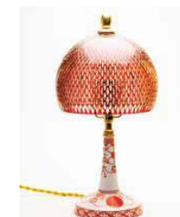
江戸切り子と有田焼の「コロボらんぶ」