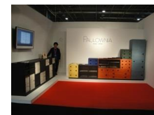
欧州市場向けに開発された、デザインと色使いに特色のある筆笥